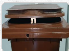
Fechadura (sob consulta)