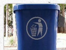
Termo Impressão (sob consulta)