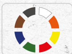
Cores do produto