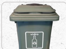
Serigrafia (sob consulta)