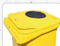
Boca Seletiva (sob consulta)